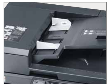
Mínimo tiempo para primera copia: 5,7 seg.