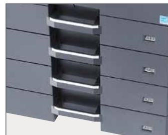
Capacidad de papel de hasta 1.300 hojas

La función copia de tarjeta ID permite copiar en una operación las dos caras de una tarjeta de identidad original en una hoja sencilla y, el modo de combinación que permite reducir dos o cuatro originales en solo una hoja.