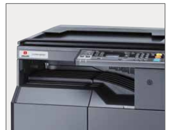
Escáner color vía protocolo TWAIN